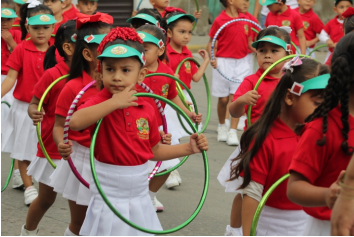
Participación en el tradicional desfile del 20 de Noviembre