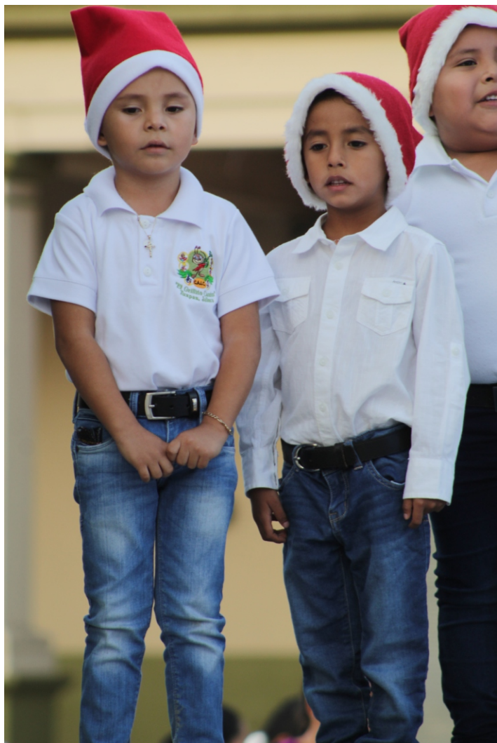
Presentación en el festival de villancicos