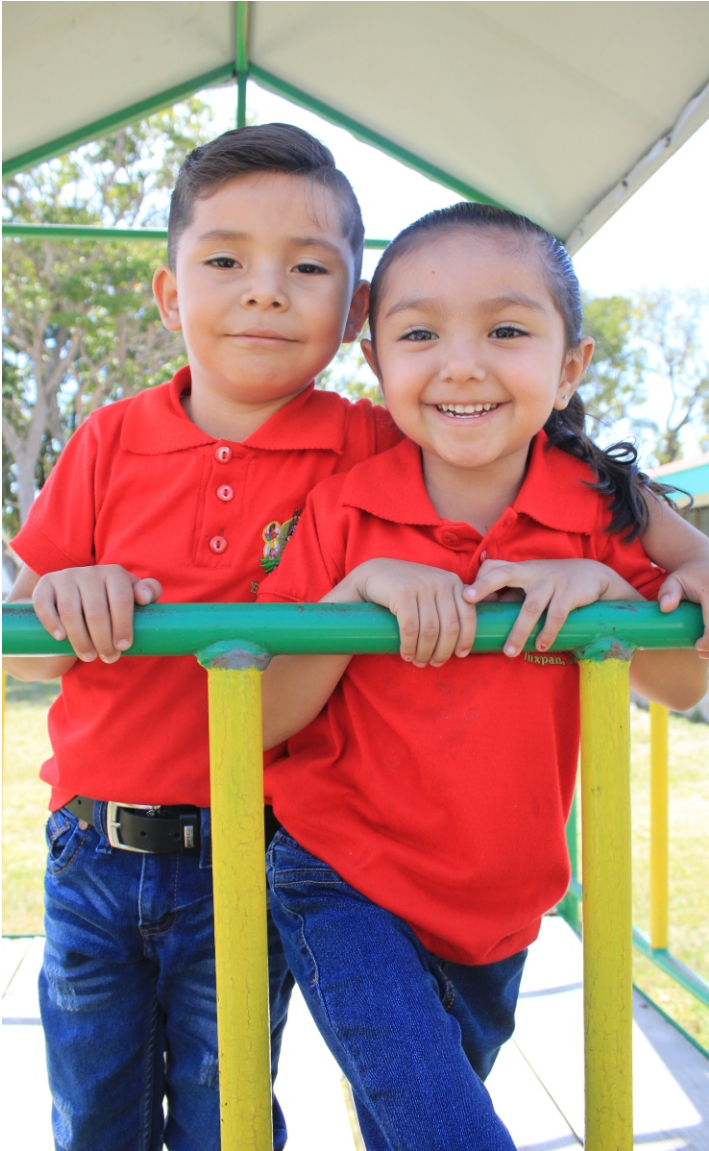
Elección de rey y reina de la primavera