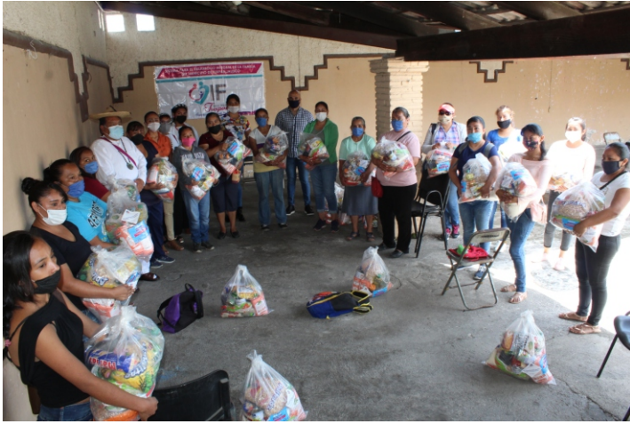
entrega de 100 despensas donadas por los migrantes a igual número de familias